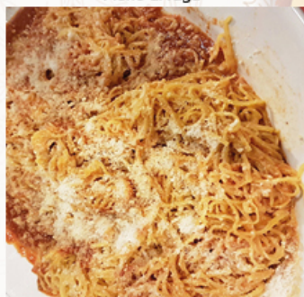
Fieno all'Ernestina (pachino, guanciale e foglie di menta)